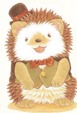
はりねずみのハリハリ

大好評！「森のえほん」シリーズ第3弾は、とってもキュートなかばん職人・ハリハリのお話です。作者のふくざわゆみこさんに聞きました！