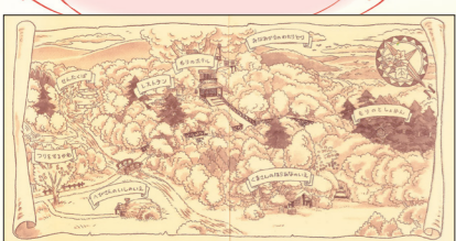
〈もりのとしよかん〉の見返し

この部分が広がりました！「くまのプーさん」みたいに森の世界が広がるという思いで描いたそうです！